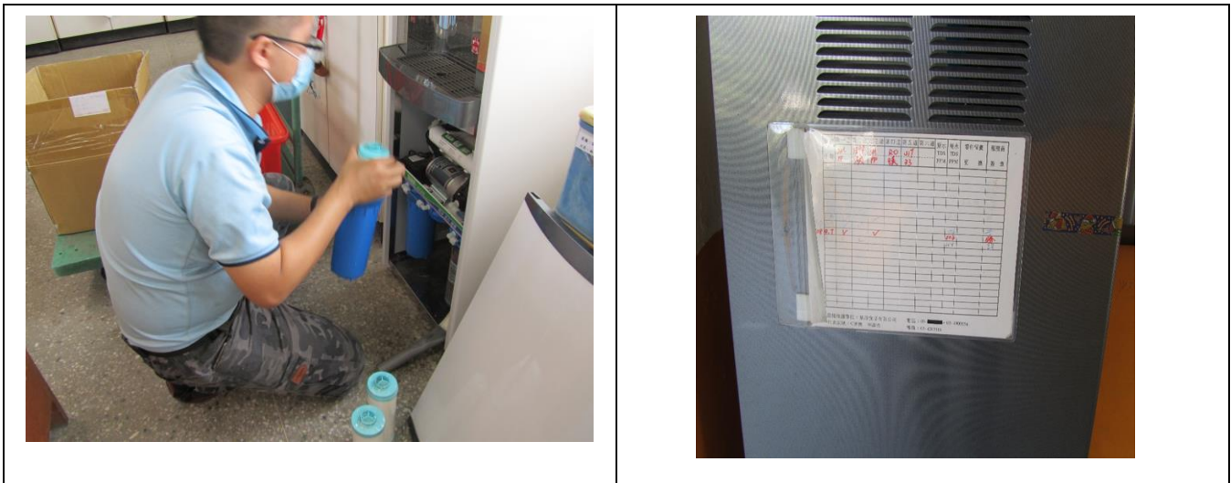
飲用水定期維護及紀錄